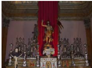
Dall'alto: Arciconfraternita della Pietà di Savigliano Confraternita di San Giovanni Decollato di Cavallermaggiore